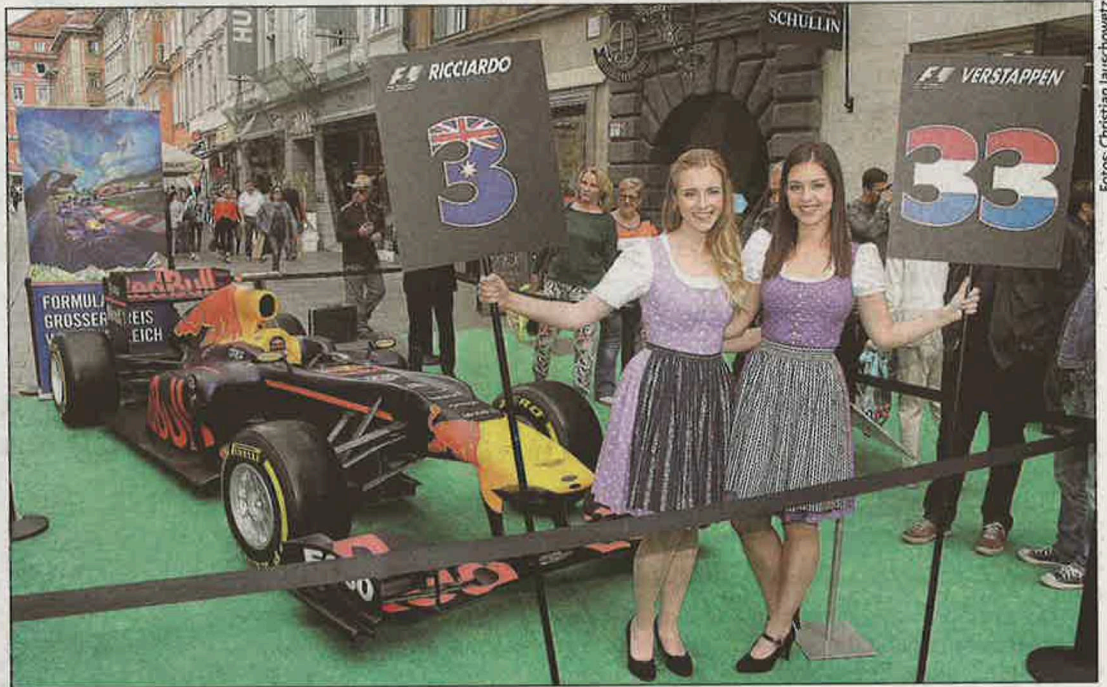
Blickfang! Der Red Bull parkte (bewacht von Grid Girls) in der Herren- und Landhausgasse ein.

Immer enger wird auch die Verbindung von Graz zum PS-Highlight in Spielberg. Ab sofort – großflächige Beflaggung –