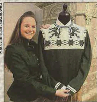
Den Pullover gibt's auch klein